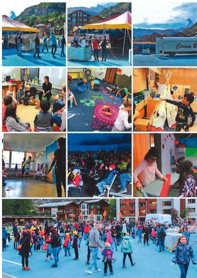
Bild- & Videomaterial zu dieser Woche stehen auf www.schulnetzmitt.ch/primarschule/zirkus zur Verfügung